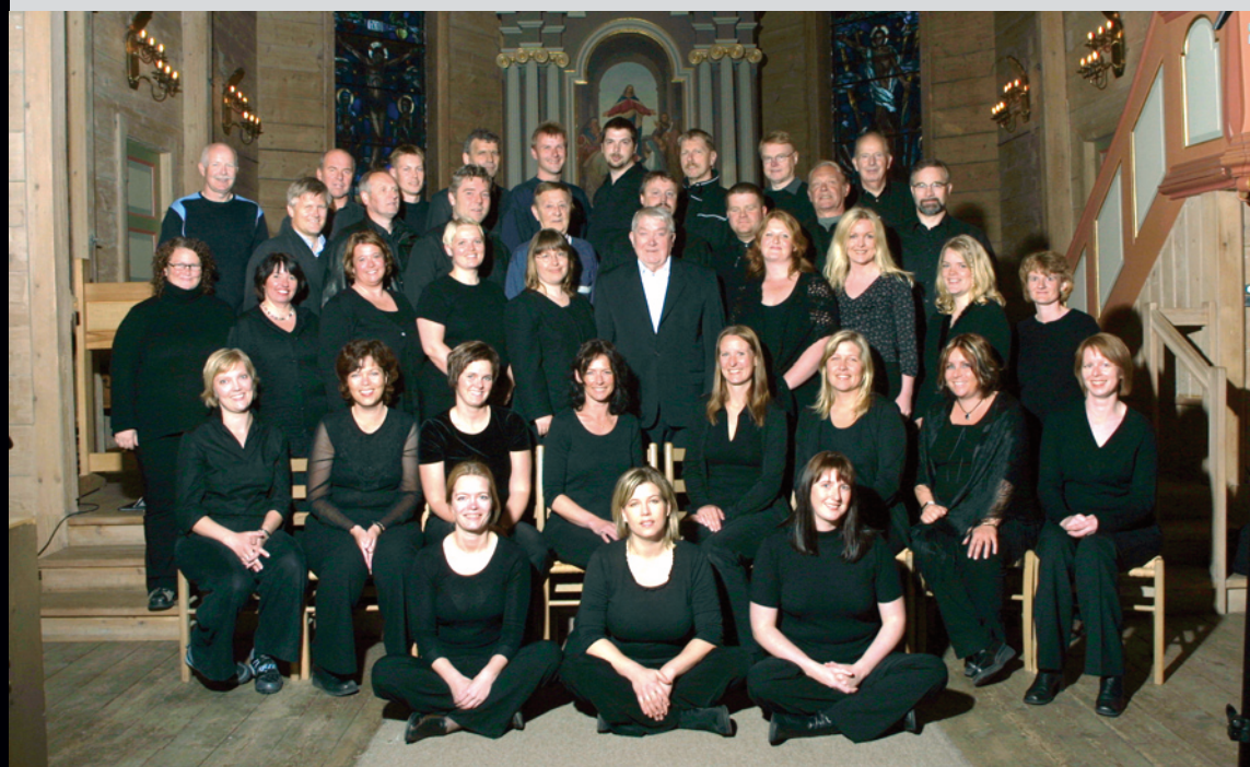
Os Vocalis och Folløso Mannskor